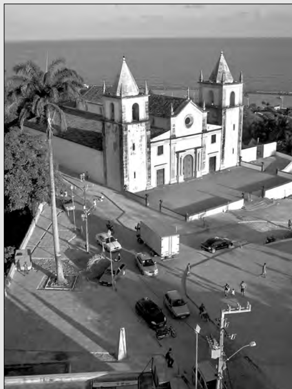
A ARQUITETURA de Olinda foi um dos atrativos citados

nas piscinas naturais de Porto, visitas aos ateliês dos artistas olindenses e passeio de catamarã no Recife Antigo. A visita foi articulada pela Secretaria de Turismo de Pernambuco em parceria com a companhia aérea American Airlines, uma vez que os Estados Unidos são o principal mercado emissor de turistas estrangeiros para Pernambuco.