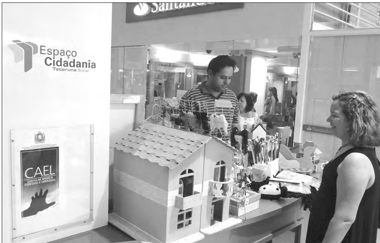
TODO O DINHEIRO arrecadado no estande será usado nas ações de reinserção dos egressos e liberados à sociedade

CAEL - A Cael possibilita acompanhamento psicossocial, pedagógico e jurídico a presidiários e ex-presidiários, visando sempre orientar e encaminhar os reeducandos nas suas novas trajetórias de vida.