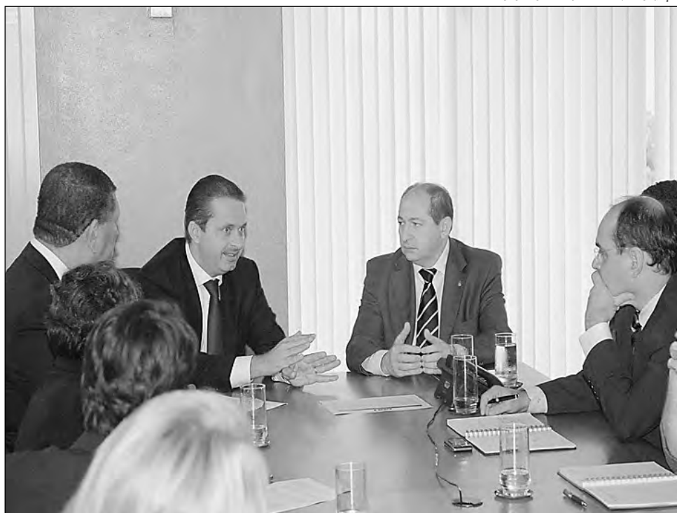
EDUARDO CAMPOS em reunião com o diretor-geral do DNIT, Luiz Antonio Pagot

cimento festejou a aprovação do projeto e a oportunidade que se abre de mais uma grande obra de infraestrutura ser delegada pelo DNIT para ser realizada pelo Governo do Estado. “Já estamos fazendo as duplicações das BRs 104 e 408 e vamos assumir mais este desafio”, afirmou Isaltino, lembrando que a requalificação do contorno