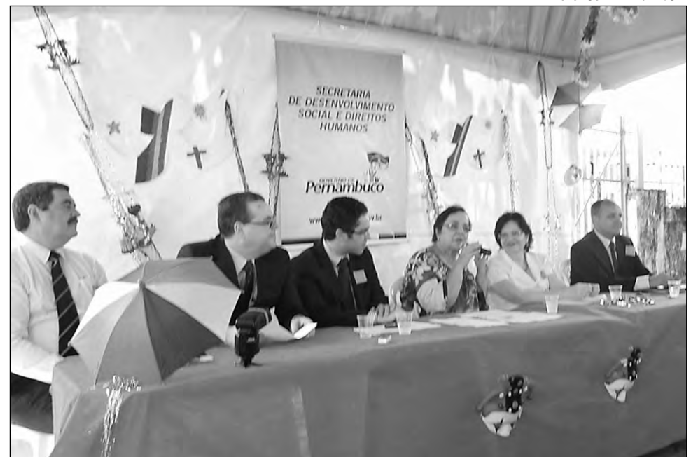
FOLIÃO COM INCLUSÃO: campanha prevê prestação de serviços na RMR e no Interior

Na Região Metropolitana, as casas funcionarão no município de Olinda, atendendo foliões na prevenção e mediação de conflitos, Ouvidoria da Secretaria de Desenvolvimento Social e Direitos Huma-