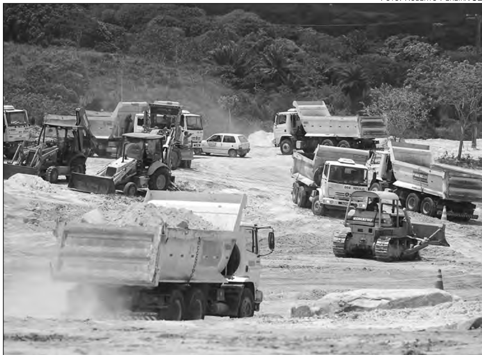
O CANTEIRO de obras da Arena da Copa recebe visita de participantes de seminário

Pernambuco sedia, nesta quarta e quinta-feira, o seminário regional Copa do Mundo 2014