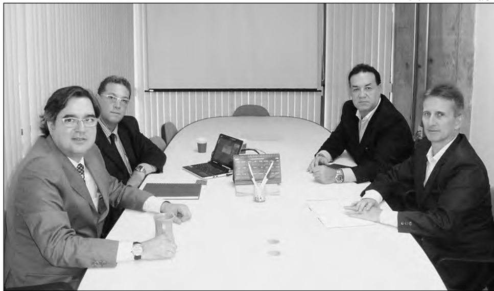
TÉCNICOS do Tocantins com representantes do Governo de PE: base para rede corporativa

Representantes do Governo do Tocantins, ligados ao setor de tecnologia da informação, estão em Pernambuco para conhecer a Rede PE-Multidigital. O objetivo é adquirir subsídios para a estruturação de uma rede corporativa baseada no modelo criado pela Agência da Tecnologia da Informação - ATI, órgão vinculado à Secretaria de Administração.