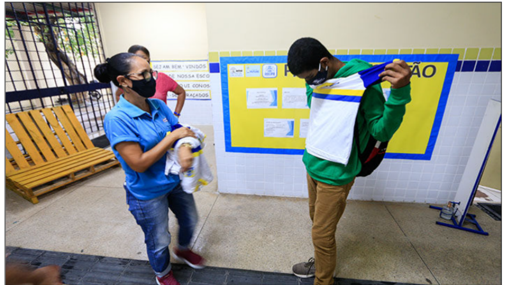
Docentes vão lecionar na Educação Infantil e Fundamentais anos Iniciais e finais

A seleção simplificada visa a contratação temporária de 500 professores, de nível superior, sendo 400 professores I, contemplando a Educação Infantil e o Ensino Fundamental Anos Iniciais, e 100 professores II, contemplando o Ensino Fundamental Anos Finais.